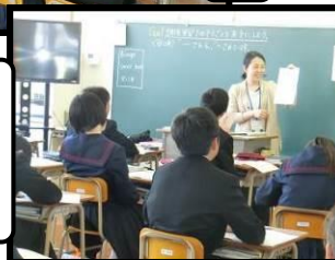
授業参観授業評価