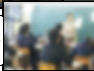
授業参観授業評価