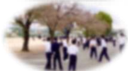
<昼休みの校庭の様子>