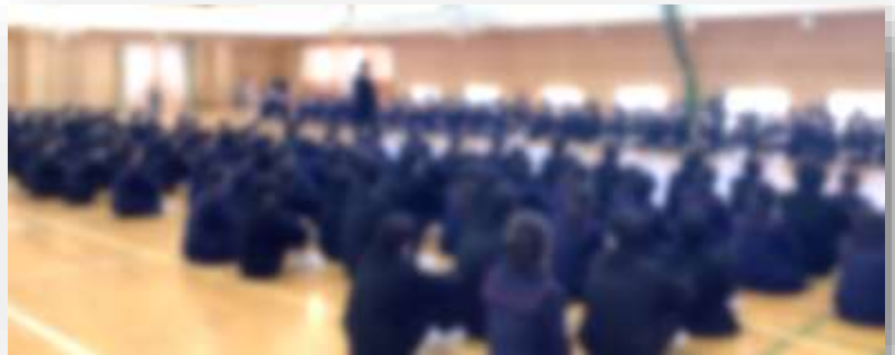
＜生徒会長 歓迎のあいさつ＞

在校生・新入生代表あいさつの後、生徒会執行部から生徒会活動について説明があり、新入生は緊張の面持ちで聞き入っていたようです。また、生徒会執行部の企画で、1年生の授業に関わる先生方を楽しく紹介する場面がありました。