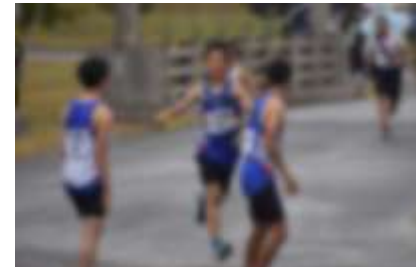
男子チーム (総合7位)