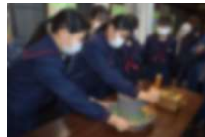
協力して臼を碾く3年生

11月5日(金)、3年生は星野にある茶の文化館、星の文化館で校外学習を行いました。茶の文化館では、碾き臼の体験を行い、その後自分たちで碾いた抹茶をおいしくいただきました。また、星の文化館では望遠鏡で昼の空に見える星を観測する等、理科に関する学習を体験的に行いました。