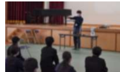
お茶の淹れ方を実演される様子

11月19日(金)、2年生は体育館でお茶の淹れ方教室を行いました。八女の特産であるお茶について、なぜ体にいいのか、どうしたらおいしく飲むことができるのか等、丁寧に説明していただき、おいしいお茶の試飲を行いました。