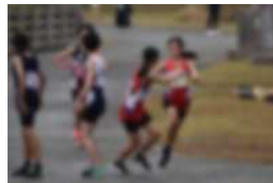
女子チーム (総合4位)

11月11日(木)、筑後広域公園において八女地区駅伝大会が行われました。時折小雨交じりのコンディションの中、男女ともに上位入賞を果たしました。早朝からの練習を行った仲間の思いをしっかりとつないで最後まで諦めない姿に勇気と感動をもらいました。